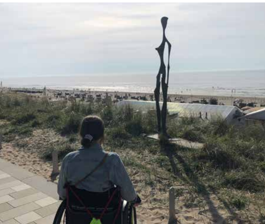
Pobyt v RNB Anně doporučila její neuroložka. Pro nemocnici, kde se léčí většinou pacienti po operacích kyčlí či kolen, byla netypickým klientem.

J e mi 29 let a již desátým rokem žiju s neoperovatelným nádorem na mozku. Gliom se nachází na mozkovém kmeni a zasahuje i do cerebella, takzvaného mozečku. A tak trpím, mimo jiné, problémy s rovnováhou a koordinací pravé strany těla. Absolvovala jsem dva operativní zákroky, sedmitýdenní radioterapii a mám zabudovaný VP shunt, hadičku odvádějící přebytečný mozkomíšni mok z mozku do břišní dutiny.