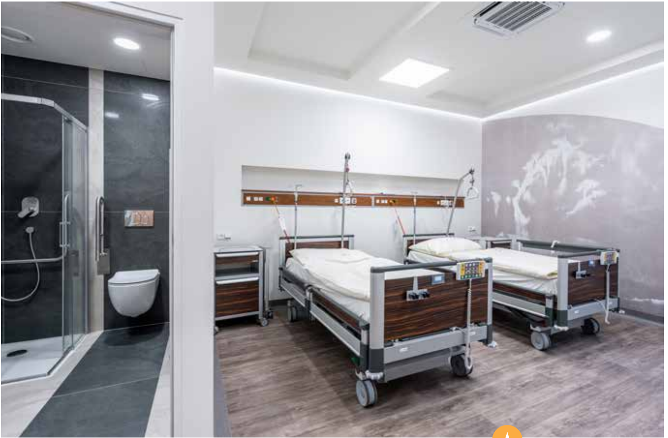
Pokoje jsou vybaveny moderními polohovacími postelími, vlastním sociálním zařízením, televizory a internetovým připojením.