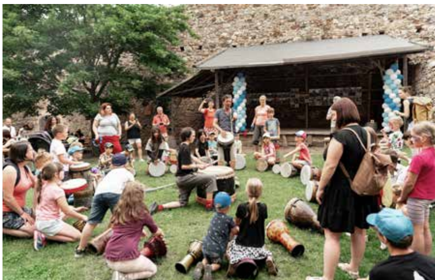
Starší děti se učily bubnovat se šamanem na 30 bubnech různých velikostí.